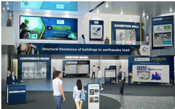
อิมแพ็คลุยจัดงาน Building Construction Technology ยกทัพอุตสาหกรรมก่อสร้าง เข้ายุคดิจิทัลผ่านออนไลน์

👍 ถูกใจ Sirisit Sujaritham และคนอื่นๆ อีก 1.2 แสน คนถูกใจสิ่งนี้