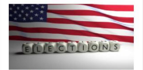
รัฐจอร์เจียยุตินับคะแนนเลือกตั้งส.ว. ภาคบิฟไน-รัฐสภายุโรปก็ทยอยนับ