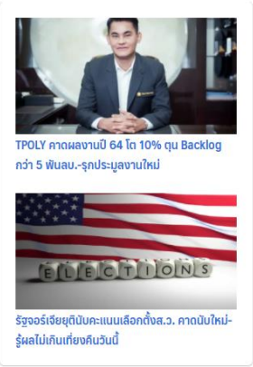
TPOLY คาดผลงานปี 64 โต 10% ทุบ Backlog กว่า 5 พันลบ.-รุกประมูลงานใหม่

สำหรับผู้ที่สนใจข้อมูลเพิ่มเติมสามารถเข้าไปดูได้ที่เว็บไซต์ www.bct-construction.com